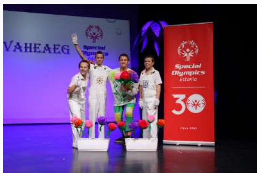
Valga Jaanikese Kooli tantsijad