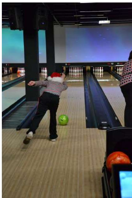
Ka üks päkapikk sattus rajale.

Eriolümpia liikumise 30. aastapäeva pidustused algasid päeval ühendava bowlinguturniiriga Akadeemia teel.