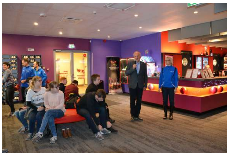
Bowlingu sõprusturniiri avab eriolümpia juhatuse esimees Urmas Paju