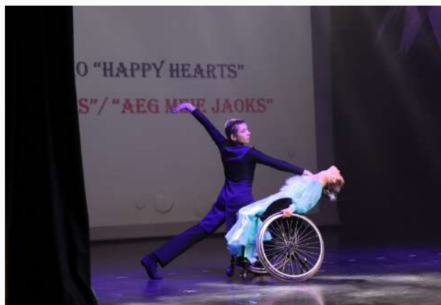
Tantsustuudio "Happy Hearts" tantsijad Narvast