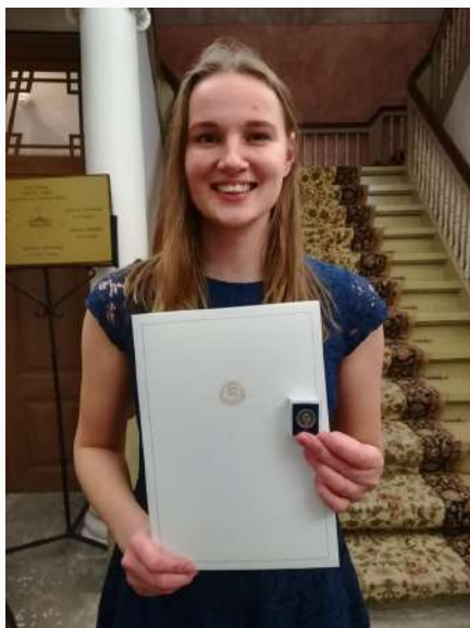
Vabatahtliku märgi ja tänukirjaga

Palju õnne! Me oleme sinu üle uhked ja väga tänulikud!