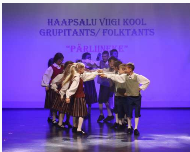
Haapsalu Viigi Kooli tantsijad