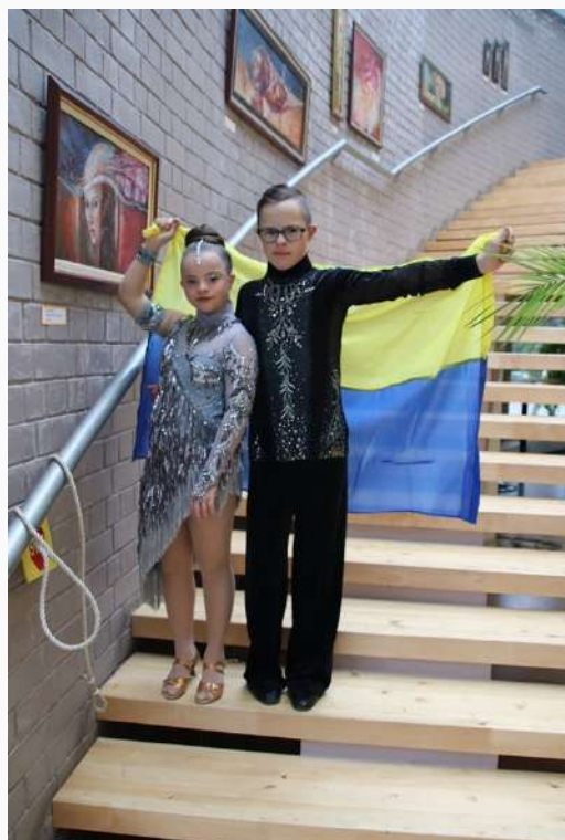
Kauged külalised Ukrainast